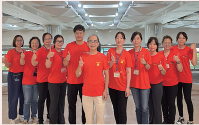
圖一 出院準備團隊

工師、藥師、營養師、心理師及個案管理師，依病人疾病狀況、功能狀態、照護能力、家庭支持與居住環境，擬定個別化出院照護計畫。過程中透過完整之疾病說明、藥物指導、返家照護衛教及後續追蹤安排，協助病人與家屬建立自我照護能力，降低出院後不確定感與照顧壓力。