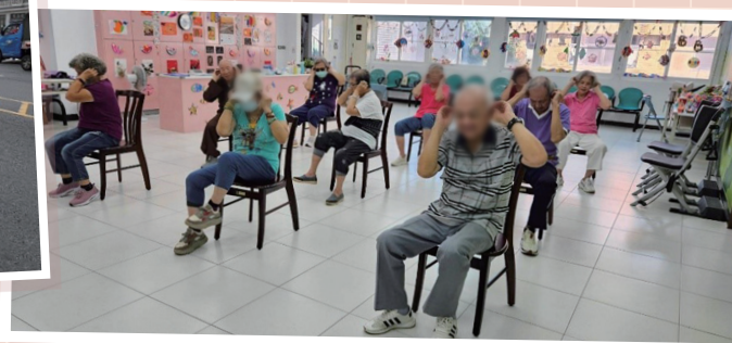
圖四 石門預防及延緩失能課程