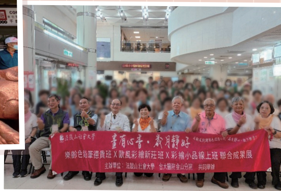
圖二 北海藝廊啟展茶會