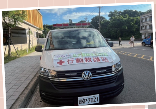
圖三 金山朝天宮遶境活動支援救護站