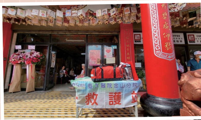
圖一 慈護宮媽祖遶境系列活動支援救護站

臺大醫院金山分院不僅是一家醫院，更是我們北海岸社區健康的守護者。它讓我們不再因醫療不便而感到無助，提升整個社區的健康福祉，成為生活中不可或缺的夥伴。臺大醫院金山分院已經成為北海岸民眾健康守護的重要支柱，能享有這樣優質的醫療資源與深切關懷，我們由衷感激，也期待未來生活能變得更加健康與美好，並為偏鄉醫療的發展開啟更美好的前景。