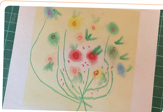
圖二 三年級腦瘤學生的花束，扁平的空間感帶有想像力