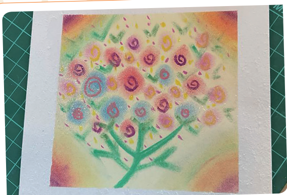
圖一 三年級小D 聰慧貼心，她的花束像花樹，豐盛美滿

為媽媽畫一張和諧粉彩母親節花束卡片，我們體驗到感恩的力量，在故事及和諧粉彩畫的交流過程中，讓母親節不只是一個節日，更加深了親子連結與心靈交流。媽媽是兒科病房裡最勇敢的英雄，願每一位媽媽都能感受到孩子滿滿的愛與感謝。獻上最誠摯的祝福，媽媽您辛苦了，母親節快樂！