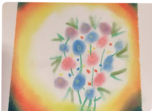
圖三 三年級的小C 作品溫暖有力量