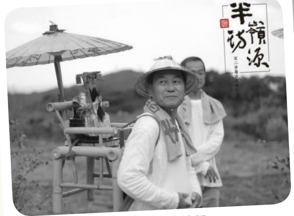
2020 半嶺訪源百二步嶺古道健行