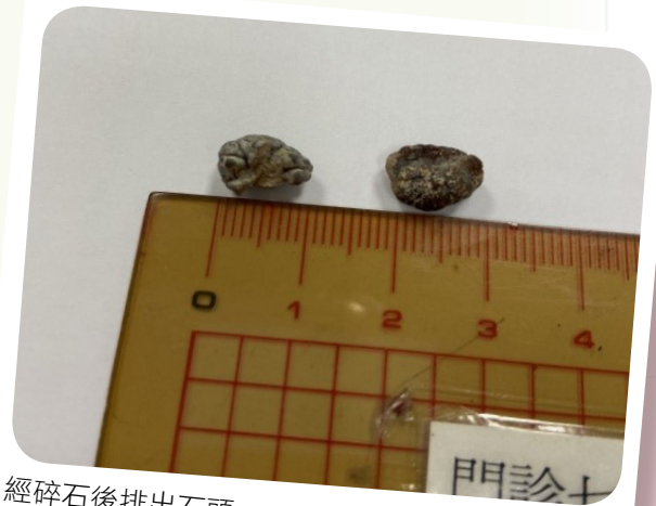
經碎石後排出石頭