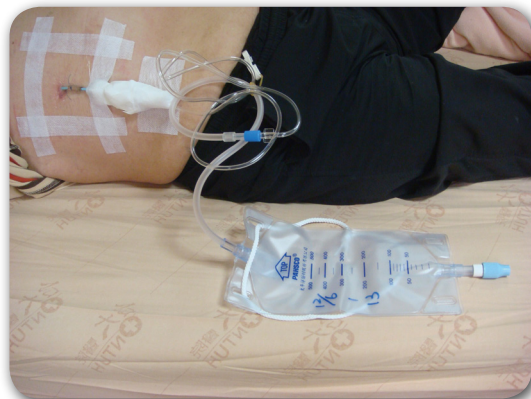
圖一、二 肝膿瘍引流管